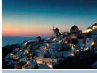
HEP BİRLİKTE SÖYLEYELİM