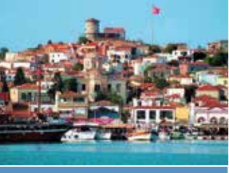
EGE'NİN İKİ ÇOCUĞU