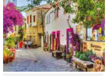
SEVGİ KURTARACAK DÜNYAYI